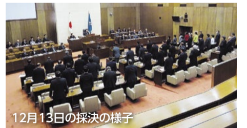
12月13日の採決の様子

12月定例会は、11月28日から12月13日まで開催されました。平成30年度一般会計補正予算(第4号、第5号) や社会福祉施設等の事業者等の要件及び設備等に関する基準を定める条例など、知事から提出された55件の議案は全て可決・同意され、委員会が提出した8件の議案は全て可決されました。