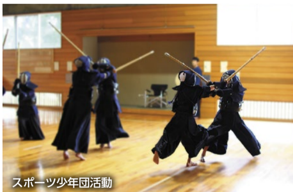
スポーツ少年団活動

今後においても、定期的な活動実態の把握に努めながら、基準を踏まえた適切な活動が定着するように取り組んでいく。