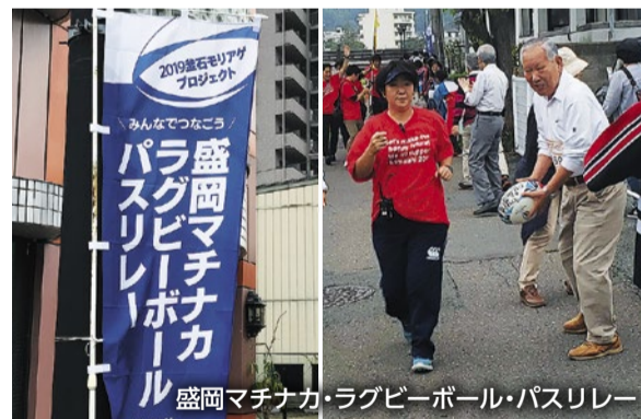
盛岡マチナカ・ラグビーボール・パシリレー

11月24日には釜石会場で行われる最後の1チームがカナダに決定し、改めて世界的スポーツイベントが間近に迫った実感が湧いている。大会を契機に来県する選手や国内外からのお客様に岩手ファンになってもらえるよう、市町村や関係団体と一層連携を強化し、歓迎に向けた取り組みを進めていく。また、復興に力強く歩み続ける岩手の姿を国内外に向けて発信し、東日本大震災津波の被災地代表としての役割を果たせるよう準備に万全を期していく。