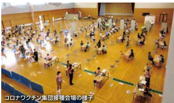
コロナワクチン集団接種会場の様子

また、主に現役世代が対象となる 職域接種 についても、補正予算案に盛り込むべく、現在準備している。