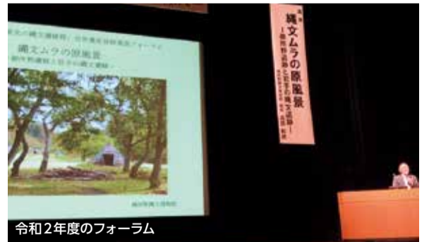
令和2年度のフォーラム

また、釜石市、平泉町、一戸町とは、住民生活と調和した遺産の保存と活用を進め、すべての人々にとって魅力のある世界遺産となるよう、情報共有しながら取り組んでいく。