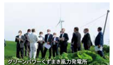
グリーンパワーくずまき風力発電所