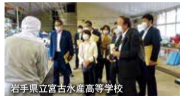
岩手県立宮古水産高等学校