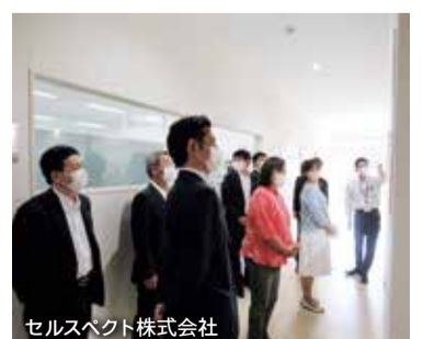
セルスペクト株式会社