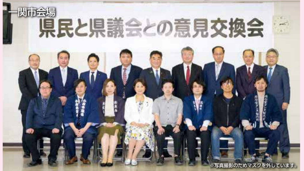
※写真撮影のためマスクを外しています。

また、大船渡会場では「女性の視点を生かした三陸の地域づくりについて」をテーマに、沿岸地域で活躍する女性たちと、賑わいを取り戻す新たな取り組みなどについて意見交換を行いました。