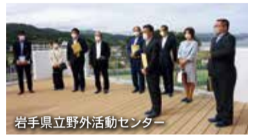
岩手県立野外活動センター

岩手県立宮古水産高等学校では、海洋生産科等における教育活動について説明を受け、宮古商工高等学校と宮古水産高等学校との一体整備、学校の魅力向上に向けた取り組みの状況などについて意見を交わしました。