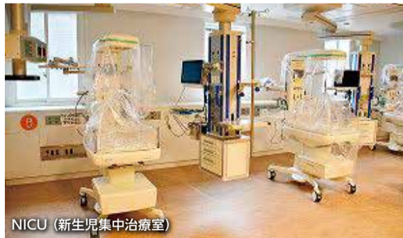
NICU (新生児集中治療室)

引き続き周産期母子医療センターとの連携による医療提供体制強化を図るとともに、産科診療所への新たな設備導入支援、周産期の救急搬送体制の強化、市町村と連携したハイリスク妊産婦の通院支援などの取り組みにより、安心して妊娠・出産ができる周産期医療の充実に努める。