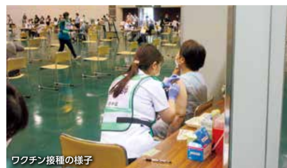
ワクチン接種の様子

知事である私については、危機管理などの観点から、状況により公務を進める上で接種が必要であると判断される場合や、ワクチンの余剰分の廃棄が目の前に差し迫って、ほかに接種を受ける方がいない状況では、接種を受けることもあると考えるが、そうした状況にない場合は、市町村が示した接種計画に沿って接種したいと考えている。