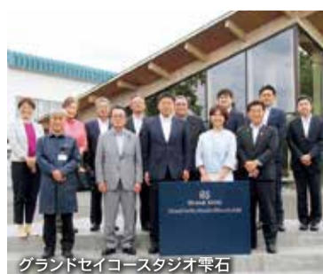
グランドセイコースタジオ栗石

[調査先]セルスペクト株式会社(盛岡市) [調査事項]最先端のヘルステック技術について