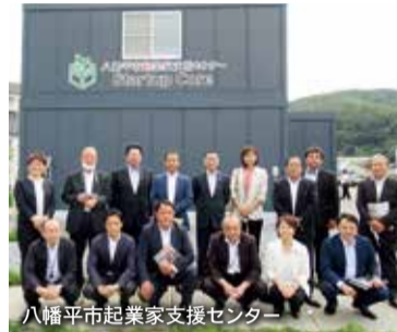
八幡平市起業家支援センター

[調査先]岩手県保育士・保育所支援センター(盛岡市) [調査事項]保育人材の確保に向けた取り組みについて