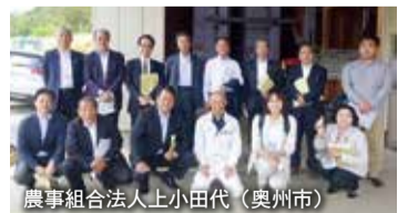
農事組合法人上小田代（奥州市）

陸前高田市では、漁業就業者育成の取り組みについて説明を受け、新規漁業就業者数の推移などについて意見を交わしました。