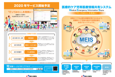
医療的ケア児等医療情報共有システム紹介パンフレット

県としては、 岩手県重症心身障がい児・者及び医療的ケア児・者支援推進会議 を中心に多様な主体による連携を強化し、法が目指す「医療的ケア児の健やかな成長が図られ、安心して子どもを産み、育てることができる社会の実現」に向け、全力で取り組んでいく。