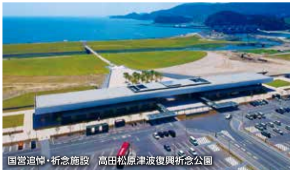
国営追悼・祈念施設 高田松原津波復興祈念公園

これまで国内外の方々に支援していただき、絆や人と人が支え合うことの大切さを実感した。犠牲となった一人ひとりのふるさとへの想いを継承し、引き続き復興の取り組みを進めるとともに、 持続可能な開発目標 の理念のもと、誰一人取り残さないよう、被災者一人ひとりの復興に力を尽くしていく。