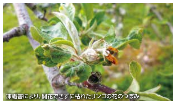
凍霜害により、開花できずに枯れたリンゴの花のつぼみ

また、スプリンクラーは、気温が氷点下になることが予想される場合に、夜間から早朝にかけて連続的に散水し、果実となる花を0度程度に維持することで果樹への霜被害を防止するものであるが、一方で、スプリンクラーの活用には多量の水が供給できる水源の確保が必要であることから、希望する生産者に対してはこうした点を確認しながら、国庫補助事業などによる導入を支援していく。