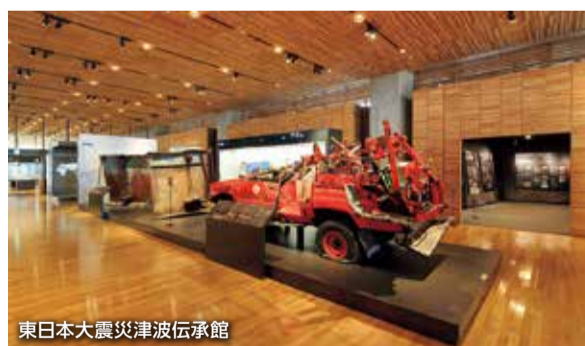
東日本大震災津波伝承館

現在のいわて県民計画では「引き続き復興に取り組みながら、お互いに幸福を守り育てる希望郷いわて」を基本目標に掲げている。人々の暮らしや仕事を起点とする施策や、県民一人ひとりに寄り添いながら多様な主体の参画やつながりを生かした取り組みを展開していく。