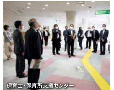
保育士・保育所支援センター