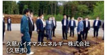
久慈バイオマスエネルギー株式会社（久慈市）

八幡平市立病院では、同病院の地域医療における役割について説明を受け、病床の稼働率や医師確保に向けた取り組みの状況などについて意見を交わしました。