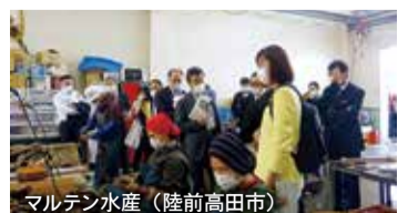
マルテン水産（陸前高田市）