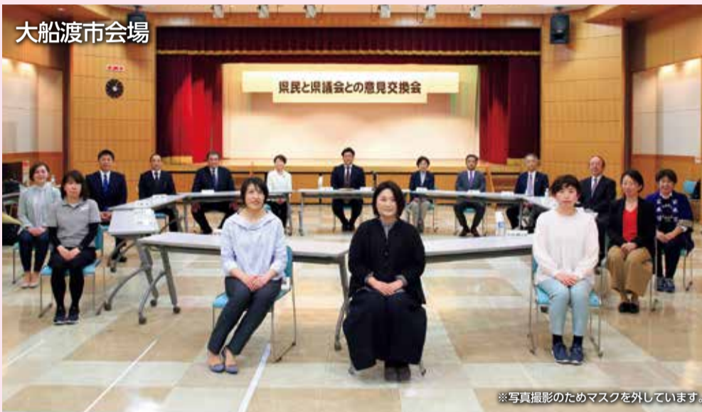
※写真撮影のためマスクを外しています。